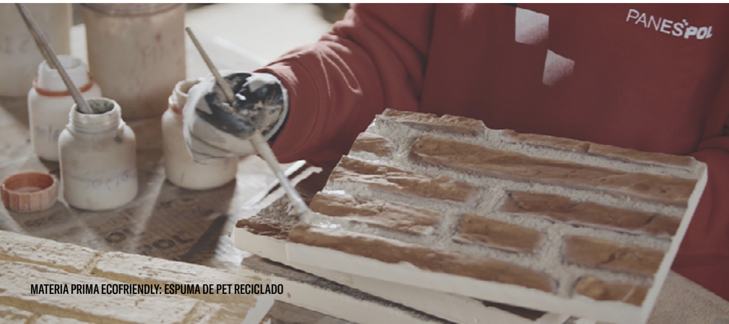
MATERIA PRIMA ECOFRIENDLY: ESPUMA DE PET RECICLADO

Además, utilizamos pinturas con iones de plata (Ag+) que mejoran el aire eliminando sustancias como el formaldehído (una de las sustancias enumeradas por la UE como motivo de gran preocupación en relación con IAQ) y aportando cero bacterias y emisiones. Contribuyendo así a higienizar las estancias respetando el medio ambiente y la salud de las personas y, por lo tanto, generando espacios más sostenibles.