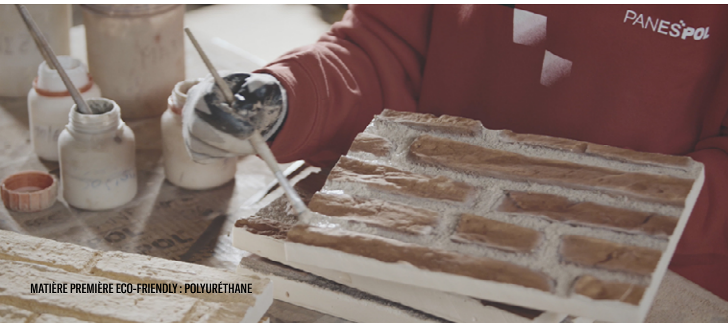
MATIÈRE PREMIÈRE ECO-FRIENDLY : POLYURÉTHANE